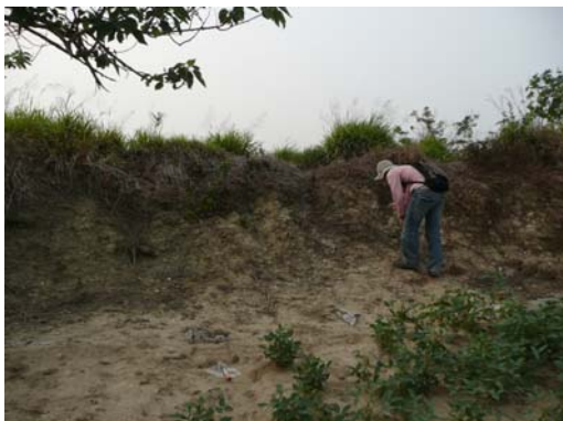
圖說：大排水溝邊坡可見少量夾砂陶片