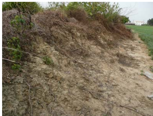
圖說：大排水溝邊坡堆土可見零星遺物